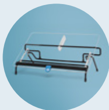
R-Go Flex Read